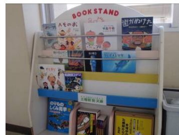
土曜朝塾文庫(児童養護施設 讃岐学園)