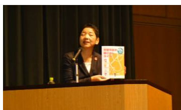
講演会の様子 (青森県鶴田町)