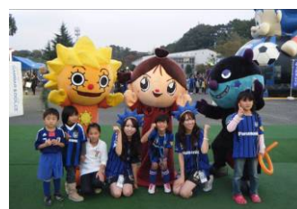
ガンバ大阪小学生無料招待デー