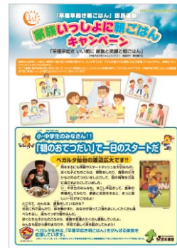
Jリーグタイアップ (ベガルタ仙台)