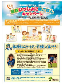
Jリーグタイアップ (ガンバ大阪)