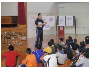
指導の様子(高松市立前田小学校)

土曜日の午前に算数、英語等の補修学習や基本的な生活習慣の確立に資する活動における助成7か所(愛知県、香川県2ヶ所、山梨県、福岡県2ヶ所、宮城県)