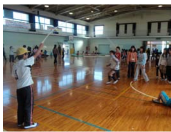
活動の様子(高松市立前田小学校)