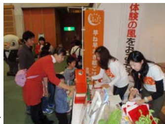
ブース出展の様子